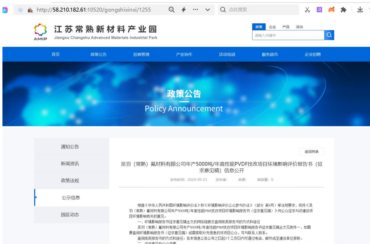
图 3-1 项目环评期间征求意见稿公示网站页面