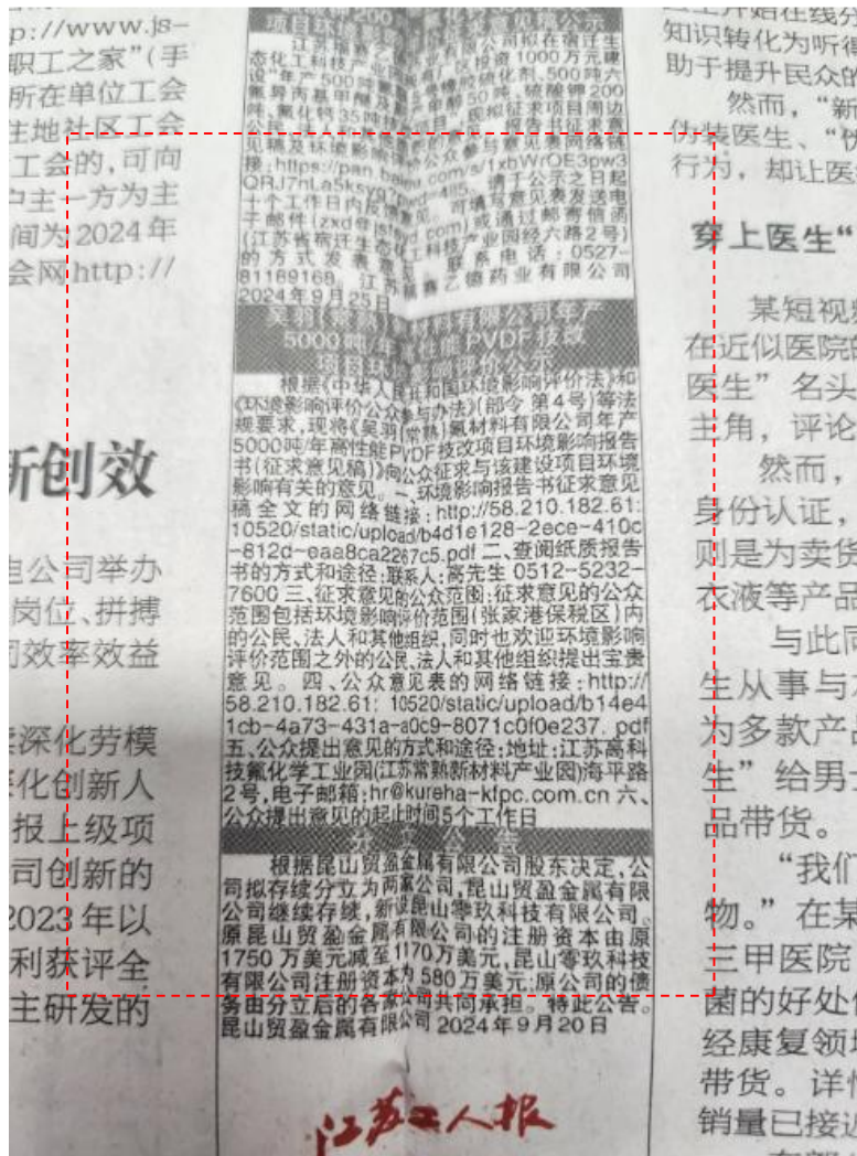
图 3-3 2024 年 9 月 27 日登报公示