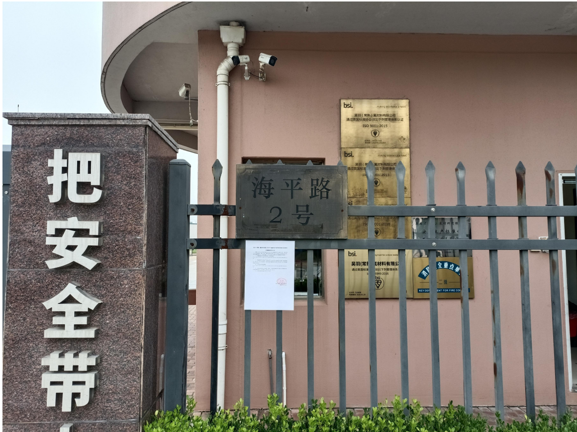
图 3-5 公司门口张贴公示（二）