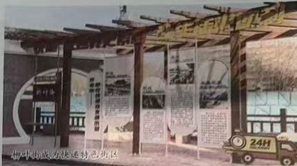
柳叶街成为快递特色街区