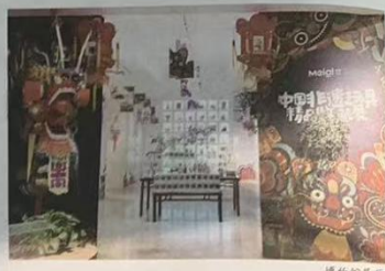
除此之外,在这方空间里,人们还能看到以惠山泥人为原材料设计的阿福,能够知晓南京本地以杂技为主题的泥人制作,北方赫哲族用鱼皮制作的鱼皮模型,以江苏54项非遗元素制作的扑克牌等,可以自己操控的皮影戏灯箱摆件等。 扬子晚报/紫牛新闻记者 张昊 王少悦

狗”等非遗,创作出“福大”“猴三”等非遗IP,造型活泼多变、萌趣十足,受到许多年轻人的喜欢。 最有意思的莫过于对创新研发的各种各样的非遗材料包,简化了原本枯燥繁琐的制作工艺,让年轻人能够根据说明书“按图索骥”,亲自动手制作一个专属自己的非遗作品。记者看到的走马灯就非常有意思,它配有一个制作材料包,可以全家齐上阵动手拼装,最终制作成走马灯成品。走马灯点燃内置小蜡烛后热气上熏,灯屏上即出现人马追逐的影像。作为世界上最早利用热气流产生机械运动的装置,它承载了古代中国人的光影经验和视觉探索,让现代人都啧啧称奇!